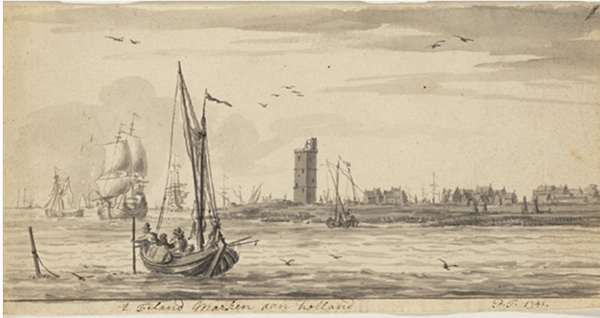
Gezicht op het eiland Marken anno 1741. (Zuiderzeemuseum)