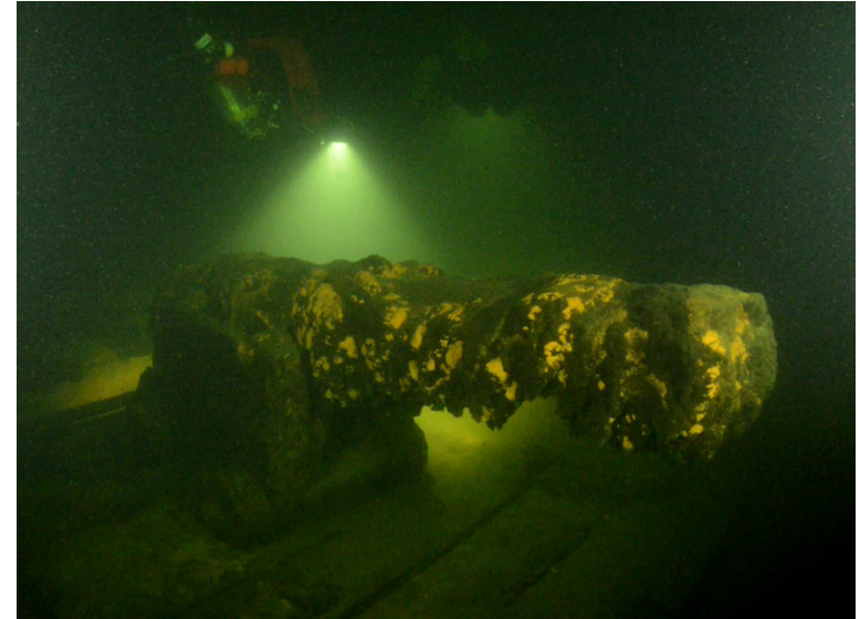
Een kanon van de Huis te Warmelo op de bodem van de Finse Golf.

Om de bemanning te completeren lijkt een gerichte wervingsactie in Friesland te hebben plaatsgevonden. Want 41 van de 129 matrozen aan boord van de Huis te Warmelo kwamen van de 'overkant'. De werving van matrozen buiten het eigen werkgebied was zeker in de tweede helft van de achttiende eeuw niet ongebruikelijk. Zo vroeg het admiraliteitsbestuur in 1765 tweemaal toestemming aan het Amsterdamse stadsbestuur om daar 30 tot 60 'bekwaame en bevarene matroosen' voor West-Friese oorlogsschepen te mogen werven.