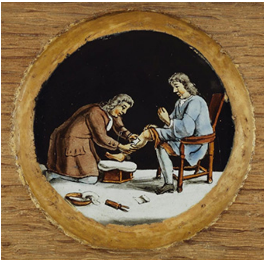
Een chirurgijn behandelt een beenwond